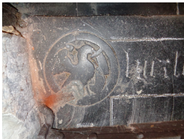
Op het hoekpunt van de zerk merkt men een uitgebeiteld ornament dat kenmerkend mag genoemd worden voor grafstenen van geestelijken. Het stelt een adelaar met een boekrol voor, gewoonlijk een verwijzing naar de evangelist Johannes.