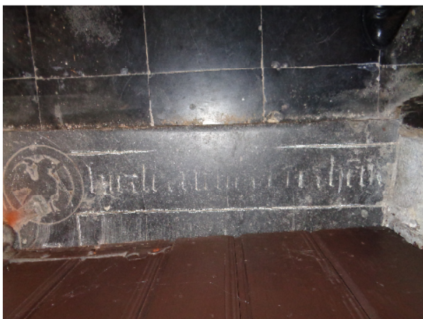
De kwestieuze grafsteen die als dorpel werd ingemetseld aan de ingang van de sacristie. Het sterk uitgesleten randschrift laat echter niet toe de begraven persoon te identificeren.

Afgaande op de brochure die in 1975 werd uitgebracht ter gelegenheid van de voltooiing van de restauratiewerken aan de kerk van Bodegem, beschouwen de betrokken auteurs Hendrik van Geldenaken namelijk als een 16e-eeuws pastoor van Bodegem. We kunnen slechts gissen naar hun overredingsgronden, maar in een volgende stap van hun boude veronderstellingen werd de beroemde 14e-eeuwse weldoener gerelateerd aan een stuk arduinen grafsteen dat zich aan de ingang van de sacristie bevindt en tot dusver nog aan niemands graf met zekerheid kon worden toegeschreven.